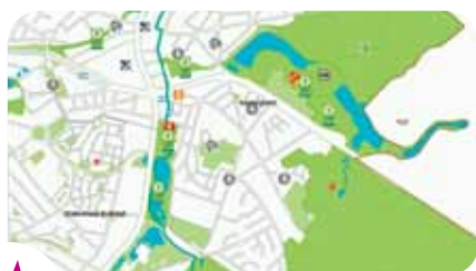
De online interactieve kaart is een krachtige en toegankelijke tool om alles te weten te komen over de Brusselse speelpleinen.

Leefmilieu Brussel ontwikkelde een interactieve kaart waarop u meer dan 300 gewestelijke en gemeentelijke speel- en sportpleinen in de hoofdstad kunt terugvinden. Via de kaart kunt u ook infochips opvragen met praktische informatie over bepaalde geïnventariseerde terreinen: adres, beheerder, bereikbaarheid via openbaar vervoer, type speeltuigen, soort