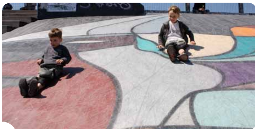
De speelpleinen in Brussel: activiteiten voor alle leeftijden en voorkeuren.

Eindelijk zomer. Voor de jongsten onder ons betekent dat twee maanden vakantie. Tijd genoeg dus om te spelen, te ontdekken, te bewegen... In Brussel zijn er meer dan 300 gewestelijke en gemeentelijke speel- en sportpleinen. De grote vakantie is de ideale periode om deze pleinen, hun verrassend aanbod en hun leuke speeltuigen te leren kennen. Via de interactieve kaart van Leefmilieu Brussel kunt u uw voorkeuren ingeven en het speelplein vinden dat het best bij u past. Leef u uit!